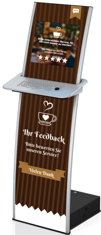
1 Standterminal I